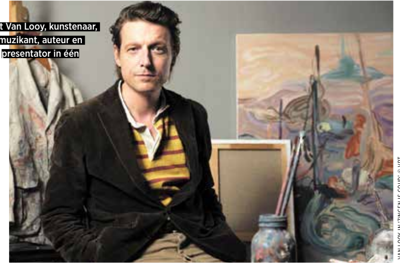
Bent Van Looy, kunstenaar, muzikant, auteur en presentator in één