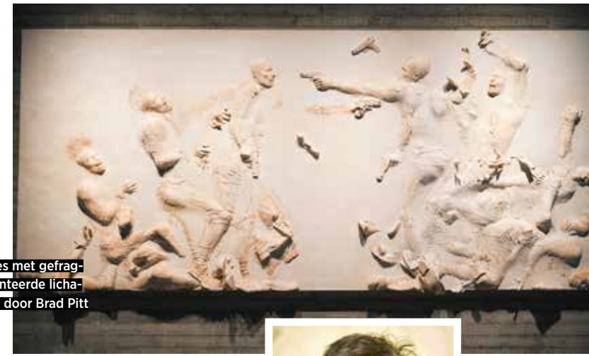
Fries met gefragmenteerde lichamen door Brad Pitt