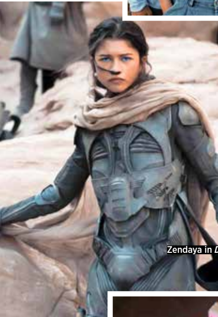
Zendaya in Dune