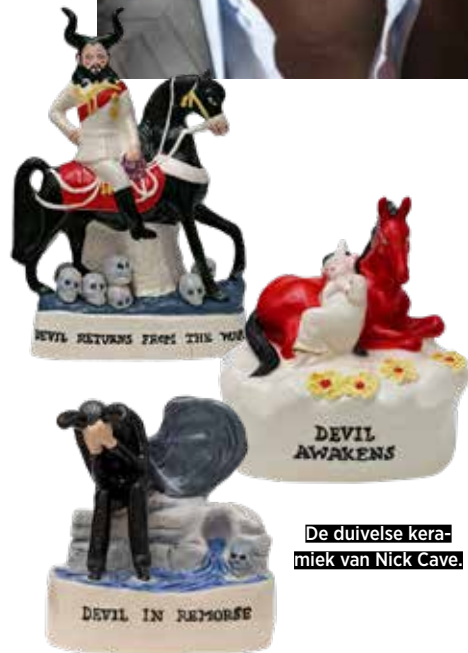
De duivelse keramiek van Nick Cave.