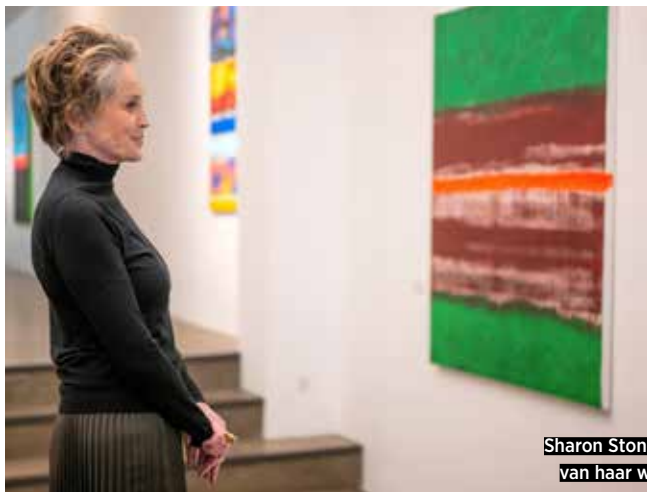
Sharon Stone bij een van haar werken.